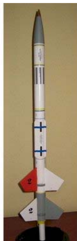
Navaho 2 etapas