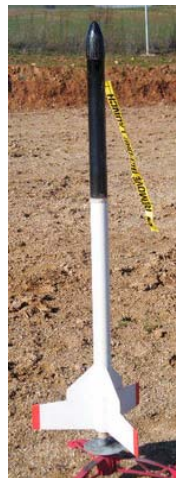
Alpha Ib de 2 etapas